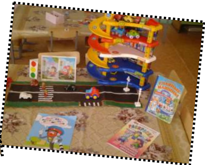
фланелеграф «Макет улицы»